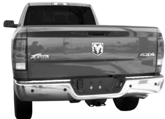
Dodge Ram Pickup

Adaptador del cableado de control eléctrico del remolque